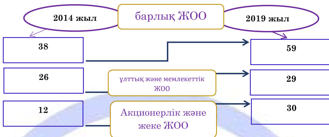
Сурет 2. АРТА/ IAAR рейтингінің объектілері бойынша статистика.

АРТА/IAAR рейтингі жыл сайын өткізіледі және рейтинг нәтижелері мамыр айында кадрларды даярлау бойынша мемлекеттік тапсырысты жариялау мерзіміне дейін, сондай-ақ ҚР мектептері түлектерінің Ұлттық бірыңғай тестілеуін, ҚР оқушыларының жалпы республикалық тестілеуін тапсыру кезеңі басталғанға дейін жарияланады.