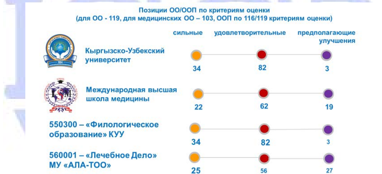
Сурет 1. ББҰ/БББ сапасының институционалдық аккредиттеу стандарттарының критерийлеріне сәйкестік матрицасы.

АРТА/ IAAR ССК БББ стандарттар өлшемшарттарына сәйкестік деңгейлері бойынша қорытындылар дайындады, олардың негіздемесі орындалған аккредиттеу рәсімдерінің қорытындылары бойынша есептерде баяндалған. Білім беру ұйымдары мен негізгі білім беру бағдарламалары сапасының АРТА/IAAR стандарттарының өлшемшарттарына сәйкестігінің сандық көрсеткіштері 1-суретте көрсетілген.